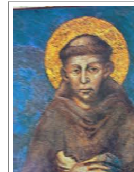
Saint François (1181-1226)