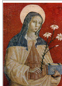
Sainte Claire (1193-1253)