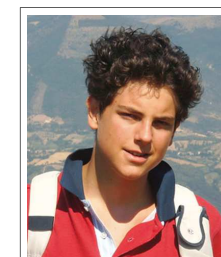
Carlo Acutis (1991-2006)