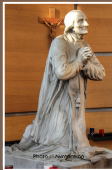
Le saint Curé d'Ars

65 rue du village - 07450 Saint Pierre de Colombier Opérateur de voyage IM007110003 - RCP : MMA IARD, n° 140291969 Garant : GROUPE ASSURANCE CREDIT, 8-10 rue d'Astorg - 75008 PARIS https://fmnd.org - saint.pierre@fmnd.org