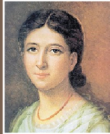
Bhse Pauline Jaricot