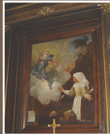
Notre-Dame du Laus