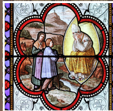
Notre-Dame de La Salette