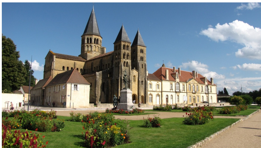
Basilique de Paray Le Monial

Retour en notre Foyer de Sens vers 22h00.